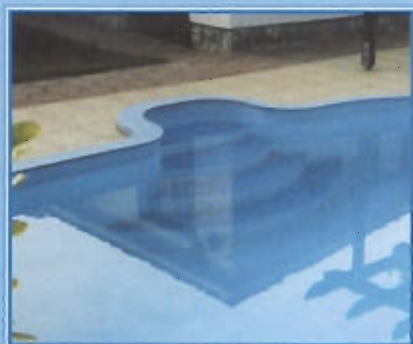
Vnější římské schody