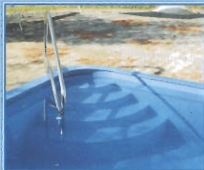
Vnitřní rohové schody s madlem