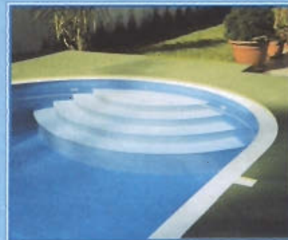
Vnitřní římské schody

Bazény lze na přání doplnit vnějšími, vnitřními, případně rohovými schody zabudovanými do tělesa bazénu. Schody jsou zhotovovány z materiálu se speciální protiskluzovou úpravou.